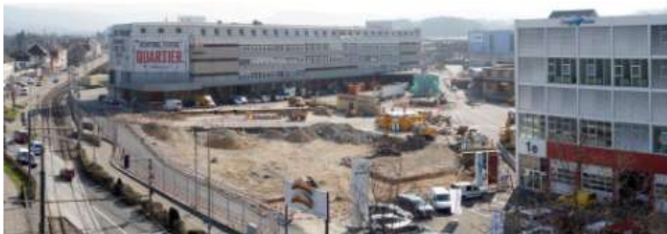
Baustelle auf dem Dreispitzareal Basel. © Hochschule für Gestaltung und Kunst FHNW Basel

© Hochschule für Gestaltung und Kunst FHNW Basel